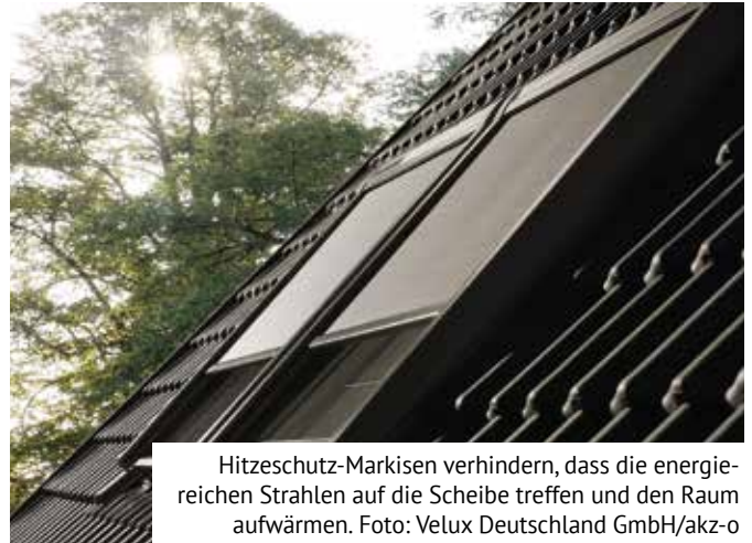
Hitzeschutz-Markisen verhindern, dass die energiereichen Strahlen auf die Scheibe treffen und den Raum aufwärmen.

In jedem Dachgeschoss gibt es aber auch Räume, in denen Tageslicht essenziell wichtig ist. Küchen oder Kinderzimmer zählen dazu. Hier bieten sich Velux Hitzeschutz-Markisen an.