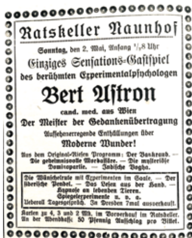
Anzeige vom Sonntag 2. Mai 1920

Was der Vortragende an Experimenten vorführte, war von Anfang bis zu Ende von einer verblüffenden Exaktheit. Mit