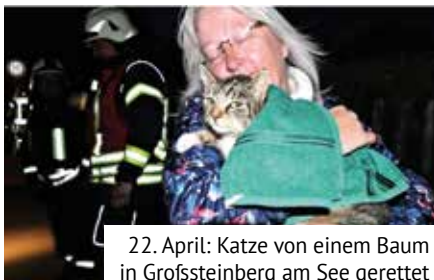
22. April: Katze von einem Baum in Grofssteinberg am See gerettet

mit festen Werten rechnen und so ist das alles nur ein Zahlenspiel, was höchstens dafür taugt darauf aufmerksam zu machen, wie wichtig der Dienst in einer Feuerwehr ist. Denn wir alle können jederzeit die „112“ wählen und uns sicher sein, innerhalb weniger Minuten Hilfe zu erhalten.