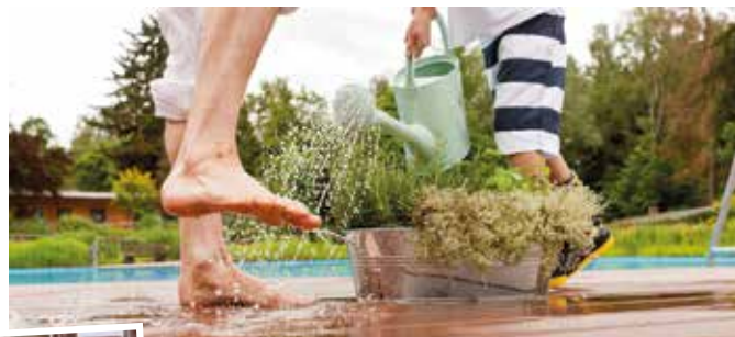
Wasser bereichert jeden Garten und sorgt für Abkühlung an heißen Tagen. Wichtig ist ein rutschhemmender Belag rund um den Pool.

Zum Abkühlen die Füße ins kühle Nass tauchen. Morgens vor der Arbeit ein paar Runden ziehen, um munter zu werden. Die Sommerferien zu Hause mit der ganzen Familie beim Toben und Planschen im Pool genießen. Wasser ist eine Bereicherung für jeden Garten und daher auf der Wunschliste vieler Hausbesitzer ganz oben. Ein Pool ist eine Investition, die dauerhaft Freude bereitet – bei der aber auch die Sicherheit nicht zu kurz kommen sollte. Ein sicherer Einstieg ins Schwimmbcken mit soliden Griffen trägt ebenso dazu bei wie eine rutschsichere Poolumrandung. Schließlich soll es beim Spielen nicht zu schmerzhaften Ausrutschern kommen.