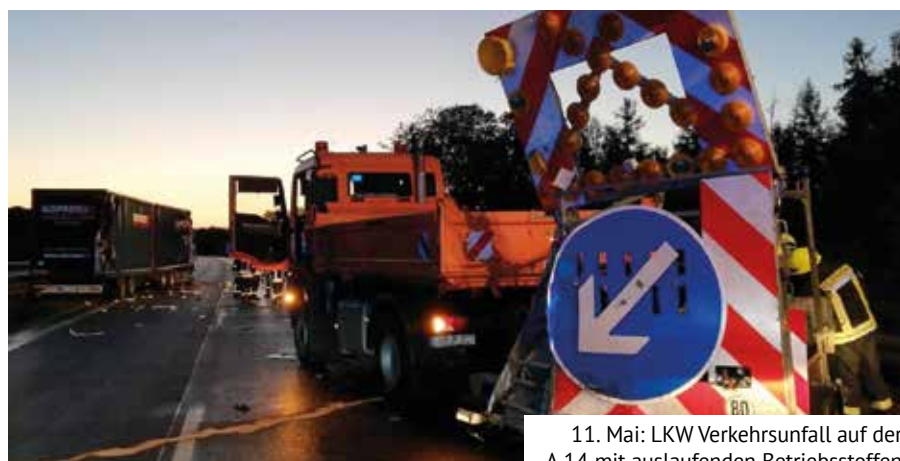
11. Mai: LKW Verkehrsunfall auf der A 14 mit auslaufenden Betriebsstoffen

windigkeit fahren. Eine Rettungsgasse wird immer zwischen dem linken und den übrigen Fahrstreifen gebildet. Der Standstreifen muss frei bleiben.