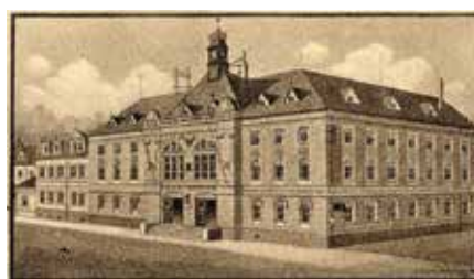
Bild vom Rathaus mit der großen Fensterfront des Saals

Das Warten war nicht vergebens, denn schon im Mai konnte Astron mit einem