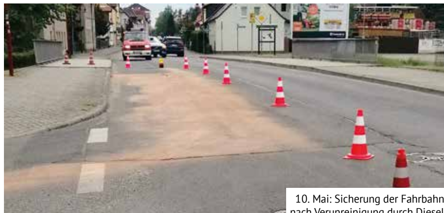
10. Mai: Sicherung der Fahrbahn nach Verunreinigung durch Diesel

Nicht erst bei einem Stau ist ein Rettungsgasse zu bilden, sondern bereits wenn Fahrzeuge auf Autobahnen oder mehrspurigen Straßen mit Schrittge-