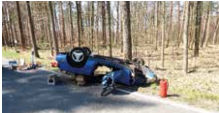
5. April: PKW Verkehrsunfall zwischen Naunhof und Ammelshain

Im April und bis Mitte Mai rückten die Kameraden insgesamt 14 Mal aus, um zu retten, zu löschen oder um technische Hilfe zu leisten. Das ist im Mittel aller drei Tage ein Einsatz. Hochgerechnet auf ein Jahr würde es ein gutes Stück über dem durchschnittlichen Jahresstatistikwert liegen. Und dabei gab es weder Unwetter noch Einsätze bedingt durch sommerliche Hitze und Trockenheit. Aber bei der Feuerwehr kann man nie