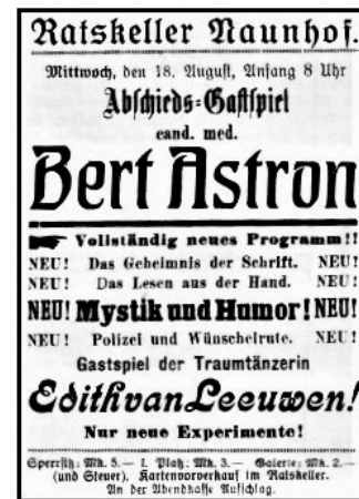
Plakat zum letzten Gastspiel

neuen Programm aufwarten, bei dem es speziell um Spiritismus ging. Wer jetzt in Naunhof von Astron noch nicht gehört hatte oder aus Zeitgründen die ersten beiden Male nicht teilnehmen konnte, hatte jetzt beim Abschiedsspektakel dabei noch die Chance. Er hatte noch einen Joker bzw. eine Dame „im Ärmel“, die jetzt als Höhepunkt der Vorstellung geboten werden konnte.